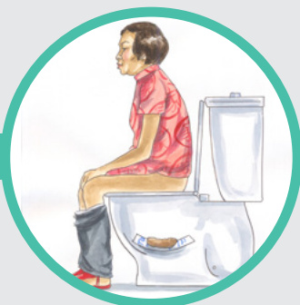
3. 再次排便， 第二只试管重复同样操作。