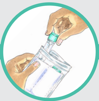
1. 将试管放入自封袋。 2. 将样本置于冰箱内。